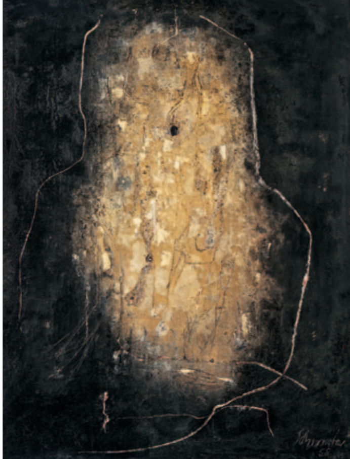
Acheron 1958 170 x 132 cm [5]