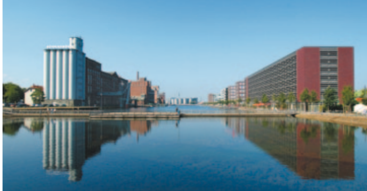
Innenhafen Duisburg mit Blick aufs MKM (1.)