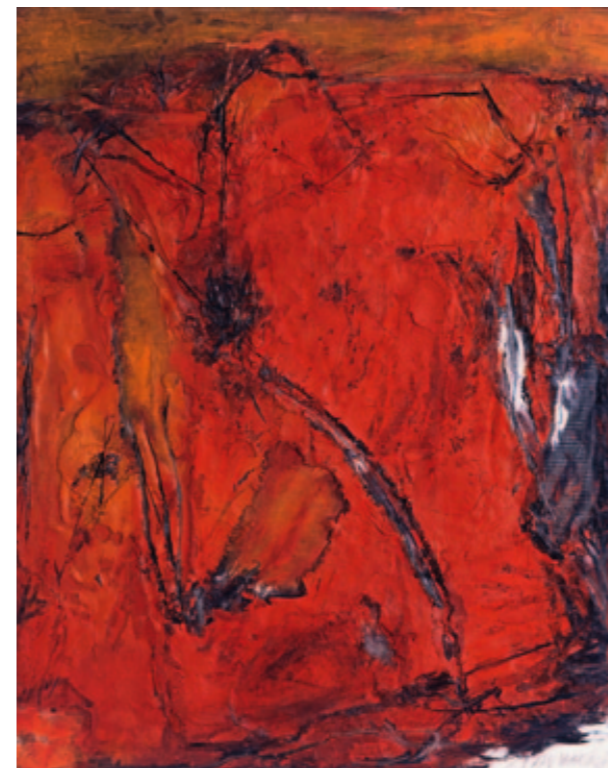
Rot I 1963 100 x 80 cm [6]