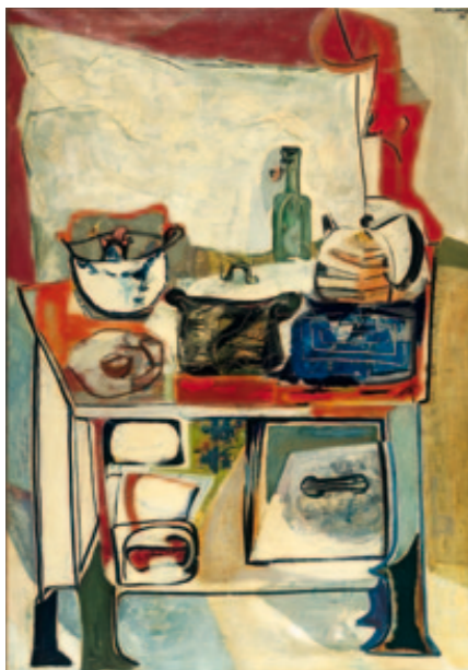
Küchenherd 1950 130,5 x 90,5 cm [3]