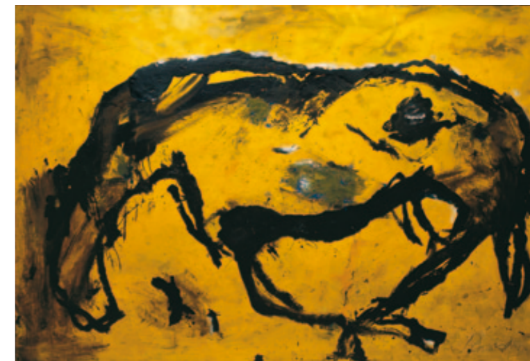
Falacca 1989 170 x 250 cm [7]